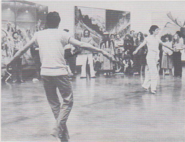
Marina Abramovic en Ulay